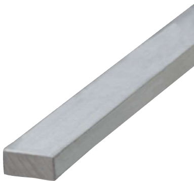
Ztužující hliníkové táhlo BP AL