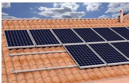
Instalace na šikmé střeše