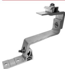
Nastavitelný hliníkový hák GTA2