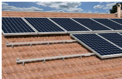
Šikmá střecha s pálenou taškou