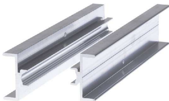
Spojka nosníků CPN AL