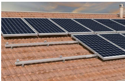
Montáž na šikmou střechu