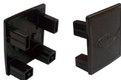
Krytka profilu Solar-fish AK SP