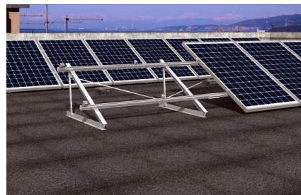
Montáž na rovnou střechu