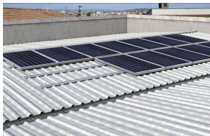
Montáž na trapézový plech