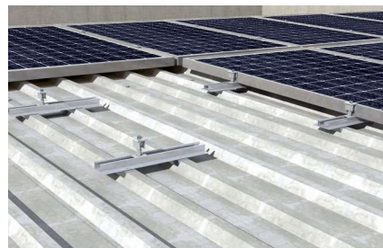
Princip využití segmentů nosníku Solar-flat