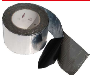
Butylová lepicí páska CG INT